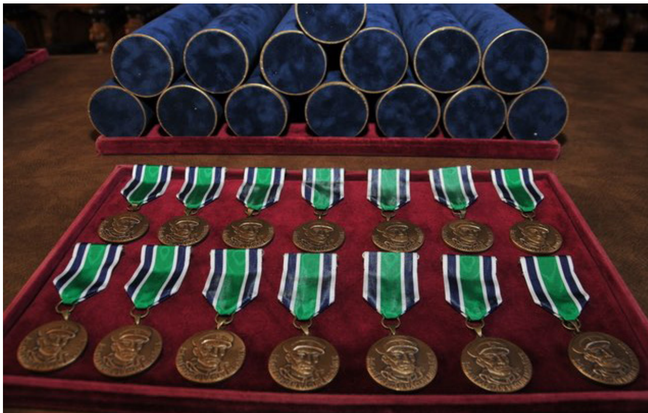
Čestný odznak štábního kapitána Václava Morávka